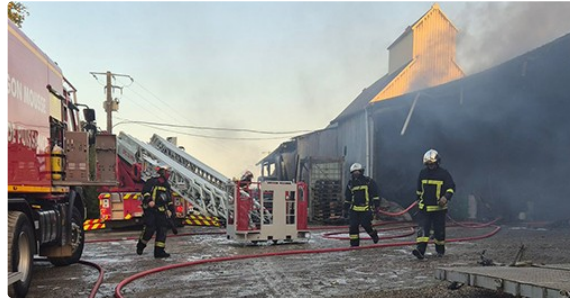
Important incendie sur un bâtiment agricole