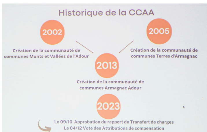
Document projeté le 24.10.2024