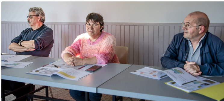
CC Armagnac Adour : réunions publiques à Bouzon-Gellenave et dans les autres communes

Tout ce que l'on doit savoir sur la Communauté de communes