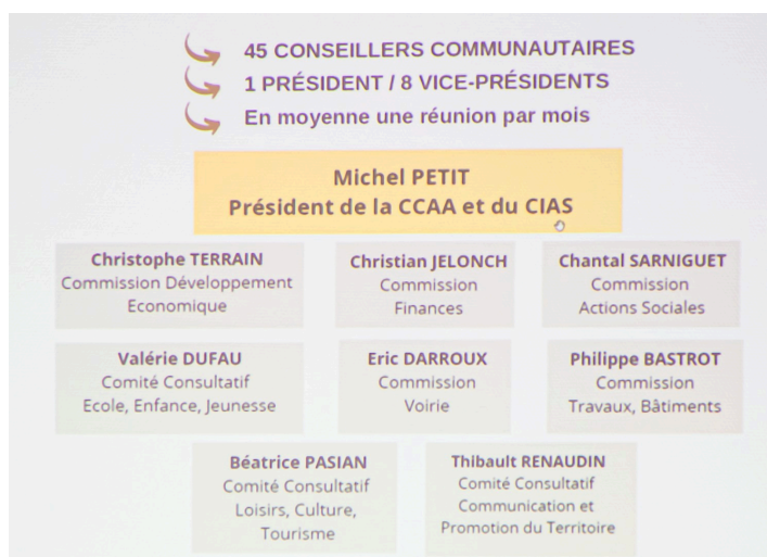
Organisation de la CCAA (document projeté le 24.10.2024)