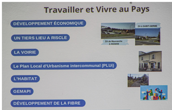
Travailler et vivre au pays (document projeté le 24.10.2024)

Et enfin « le Budget » qui est expliqué en détail (2).