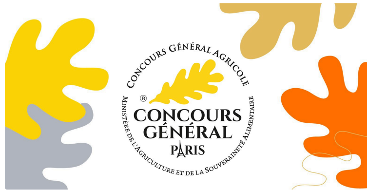
Immense succès pour les formations du Concours Général Agricole !

L'édition 2025 du Concours Général Agricole rencontre un engouement sans précédent, avec l'inscription de 3 500 futurs jurés aux formations en seulement trois jours !