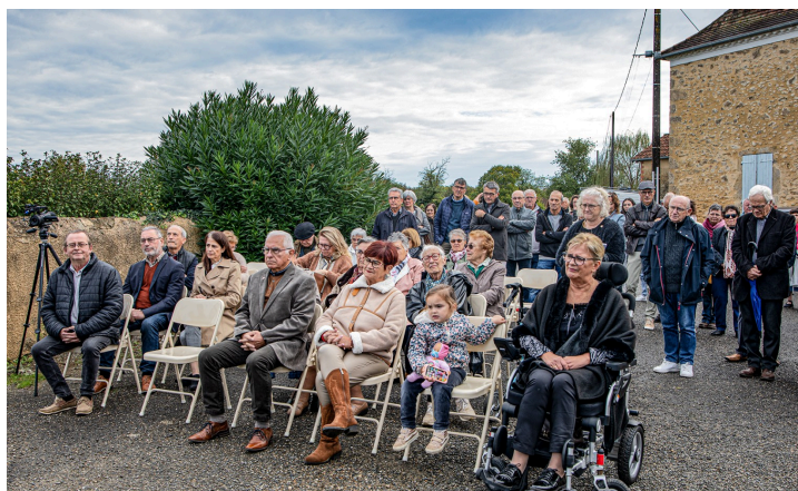
Les autorités (1er rang)