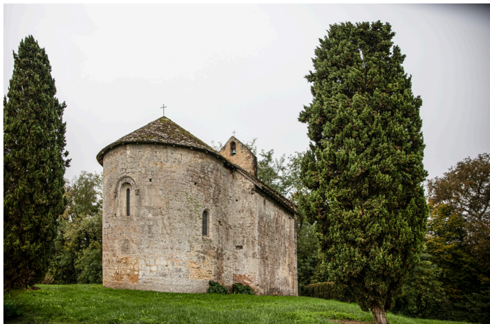
La chapelle de Bouzonnet (restaurée)

Un pupitre mémoriel a été également posé à côté de la chapelle de Bouzonnet à Bouzon-Gellenave.