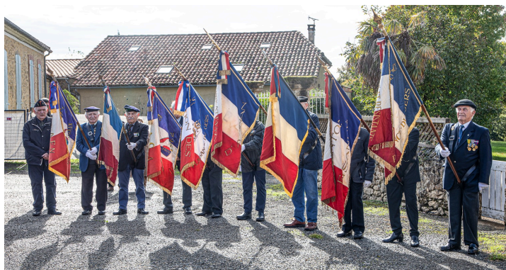
Le salut des drapeaux