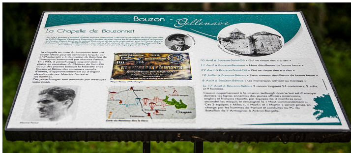
Le pupitre à côté de la chapelle de Bouzonnet