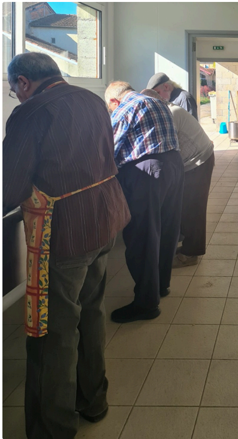
les 4 mousquetaires, photo crédit Eric Linsen.jpg