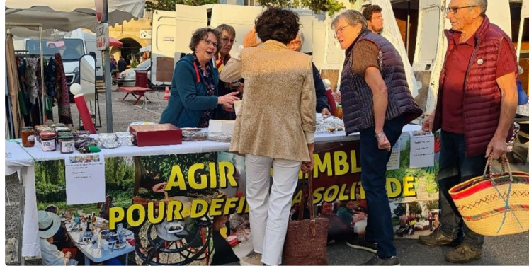
Agir Ensemble pour Défier la Solitude