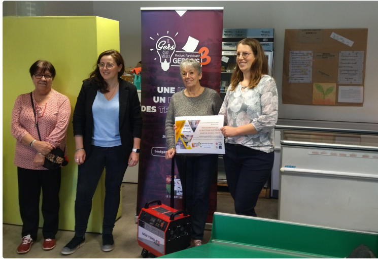
Budget Participatif Gersois : inauguration de la batterie électrique à Vic Accueil