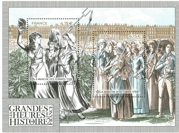
La marche des femmes à Versailles, 5 octobre 1789

Le 12 novembre 2024, La Poste émet un bloc de la série les Grandes Heures de l'Histoire de France, illustré par deux timbres sur la marche des femmes à Versailles le 5 octobre 1789 qui précipita la fin du règne de Louis XVI.