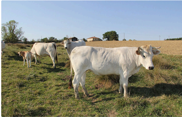
Vaccination contre la FCO-3 dans le Gers

La FCO 3 est une nouvelle maladie des ruminants apparue en août 2024 dans le Nord de la France, ayant des conséquences sanitaires importantes dans les élevages de ruminants, notamment dans la filière ovine. Sa zone régulée a fortement augmenté, avec l'apparition récente d' un nouveau foyer en Corrèze . Désormais, quelques communes au Nord du Gers (9) sont situées en zone régulée.