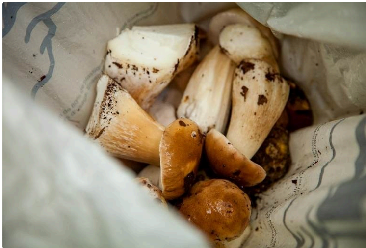
La cueillette des champignons, oui, mais avec modération et quelques précautions !

L'automne est là et la cueillette des champignons, seul ou en famille, va reprendre de plus belle. Cette activité attire de plus en plus d'amateurs et de curieux en tout genre. Certains reviennent le panier plein, d'autres les mains vides.