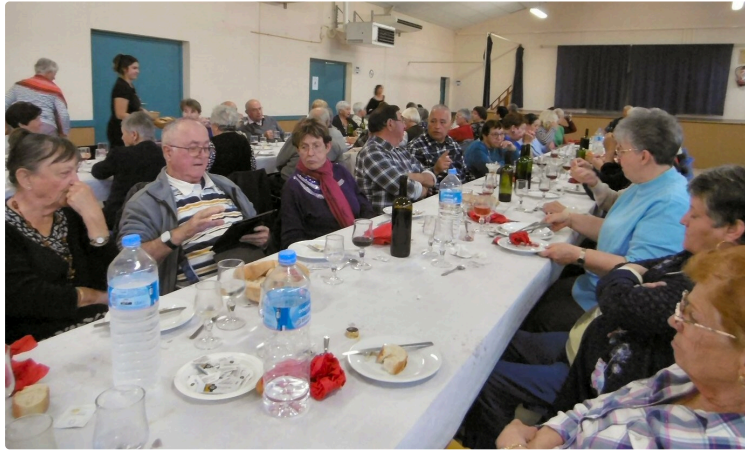
Los Sanquetos se sont retrouvés pour le dernier repas trimstriel de l'année

Accueillis à la Salle des fêtes de Labarthe