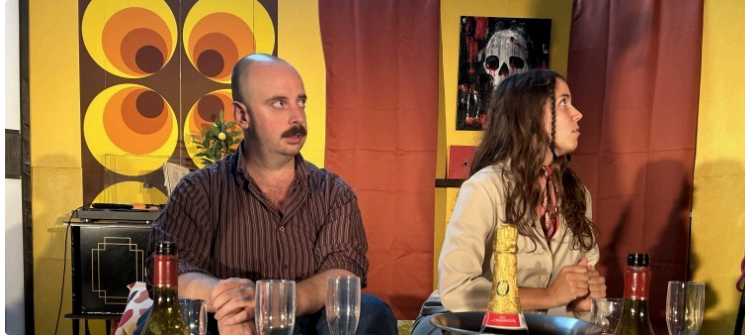
Après-midi théâtre dimanche prochain avec "Tapis jaune" de la compagnie Dryadalis !

In § Off innove en cette nouvelle saison et répond à la demande qui lui a été faite, celle d'une après-midi théâtre.