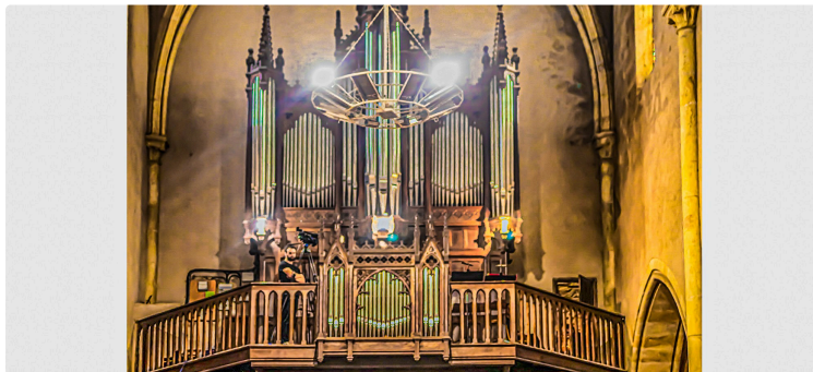
Concert violon, violoncelle et orgue au Houga

Une nouvelle fois, les Amis des Orgues du Houga organisent un concert : le dimanche 20 octobre 2024 à 17 heures en l'église Saint-Pierre.