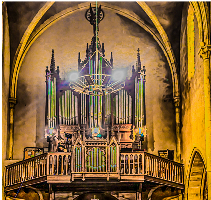
L'orgue de l'église Saint-Pierre du Houga