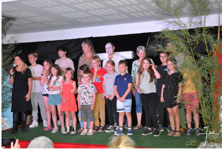
Stage de théâtre "Halloween" : inscrivez-vous !

Tu as entre 7 et 14 ans et envie de "jouer" à faire peur ou d'avoir peur ?