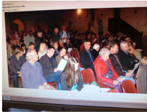
une assistance nombreuse