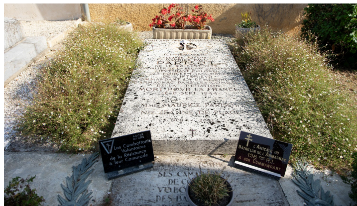
Tombe du Colonel Parisot à côté de l'église de Saint-Gô

N.B. - Sur la photo du haut de page : le site de l'église de Saint-Gô.