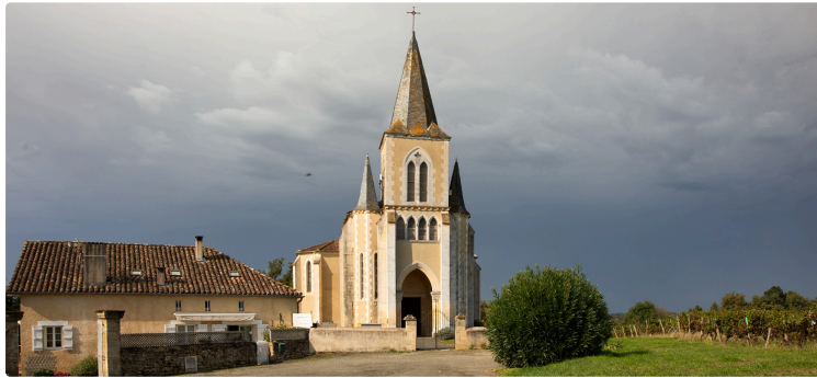
Bouzon-Gellenave : pose d'une plaque commémorative Maurice Parisot, Saint-Gô et Bataillon de l'Armagnac