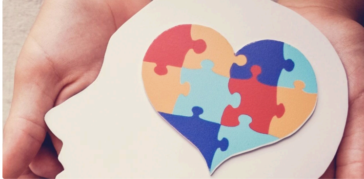
Semaines d'information en Santé mentale (SISM)

Lundi 7 octobre ont commencé les Semaines d'Information en Santé Mentale. Elles se dérouleront jusqu'au 20 octobre prochain.