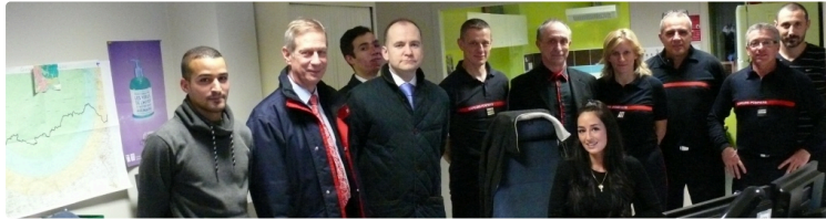
AUCH Les opérateurs de la plateforme du SDIS sereins pour leur soirée de la Saint-Sylvestre

Ils ne s'attendent pas à une soirée plus agitée que les autres