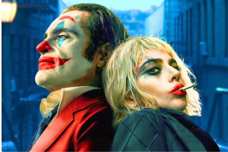
Cinequanon : programmation du mercredi 9 au mardi 15 octobre 2024