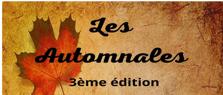
Les automnales font étape à Bivès

La 3 e édition de "Les Automnales" emprunte cette année les chemins buissonniers de Lomagne et vous donne rendez-vous à la Salle de Fêtes de Bivès les 19 et 20 octobre.