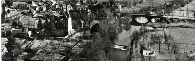
Un livre sur les moulins en Astarac présenté vendredi 4 octobre à Villecomtal-sur-Arros