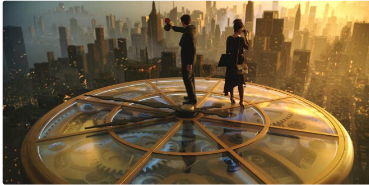
Cine Qua Non : programmation du mercredi 2 au mardi 8 octobre 2024