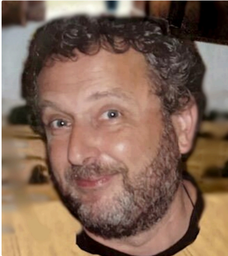
Concours d'Écriture théâtrale : hommage À « Eric Durnez »

« Lire et écrire en Gascogne » est l'ode à la création des auteur-e-s et des arts à Castelnau d'Auzan.