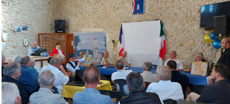
Rugbitalia 2e édition : le match retour aura bien lieu !