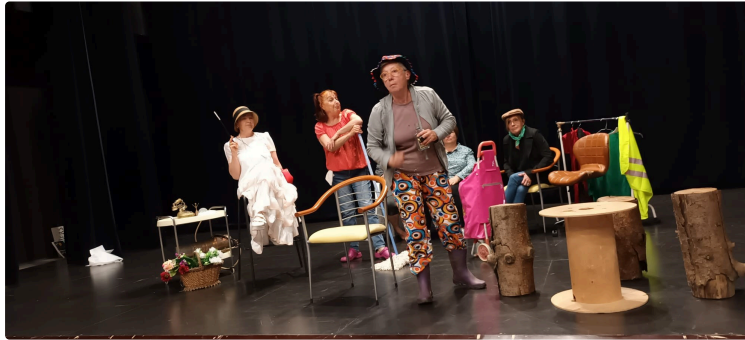
L'atelier théâtre "Didascalies en Liberté" présente une comédie inspirée de Boris Vian

Salle des fêtes de Saint-Lizier-du-Planté.