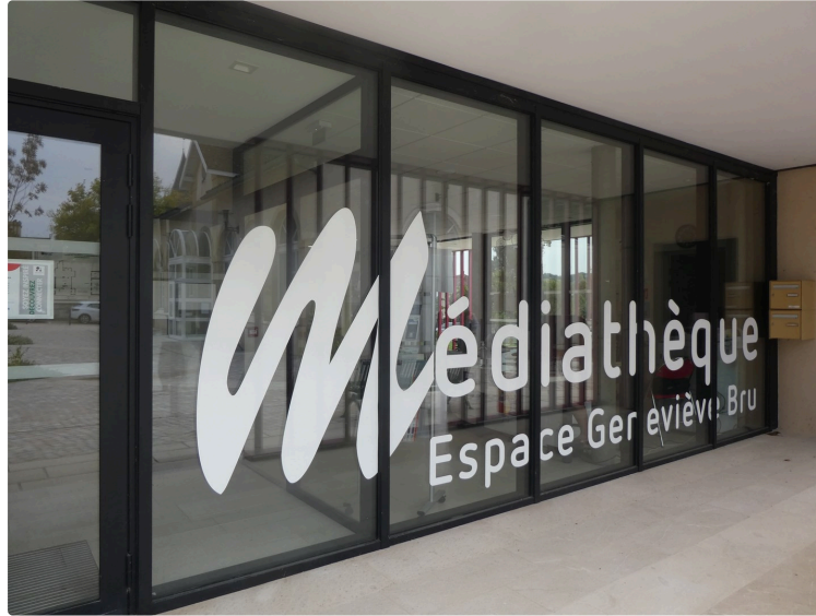
Le mois d'octobre à la Médiathèque