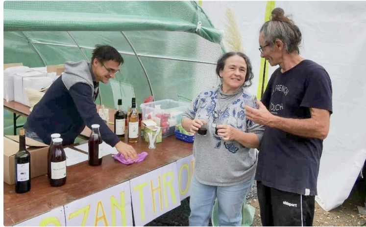
Belle réussite pour le salon Biozan!

Le Salon Biozan 2024 de Castelnau d'Auzan s'est déroulé dans une atmosphère à la fois festive et enrichissante, réunissant exposants, participants et bénévoles autour de valeurs profondes liées à la nature, à l'écologie et à la convivialité. Ce rendez-vous, qui semble s'imposer comme un incontournable, a permis de combiner savoir-faire artisanaux, réflexions écologiques, et moments de partage humain, le tout dans une ambiance décontractée mais profondément ancrée dans des réalités.