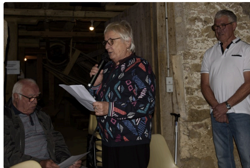
Soirée moulin 21092024 (2).jpg