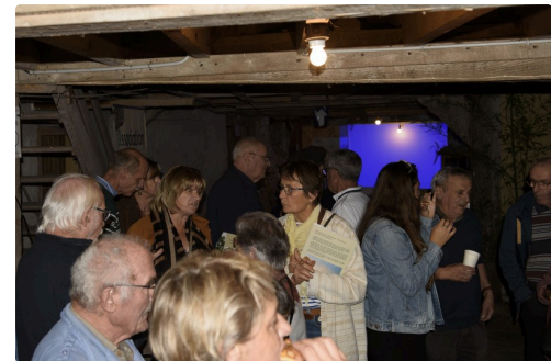
Soirée moulin 21092024 (5).jpg