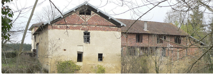
Soirée au moulin