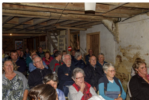
Soirée moulin 21092024 (4).jpg