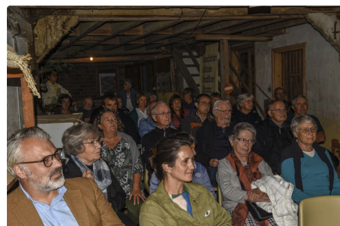
Soirée moulin 21092024 (3).jpg