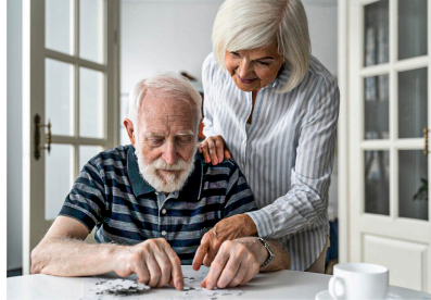
Journée Alzheimer le 03.10.2024 à l'hôpital de Nogaro : l'occasion d'en savoir plus sur la recherche et de faire un don

Randonnées, apéritif à l'hôpital et repas au circuit