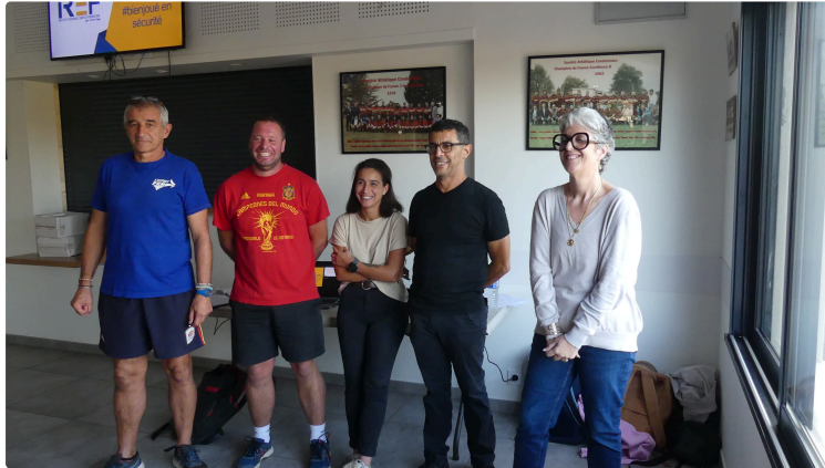
La troisième mi-temp... on en parle