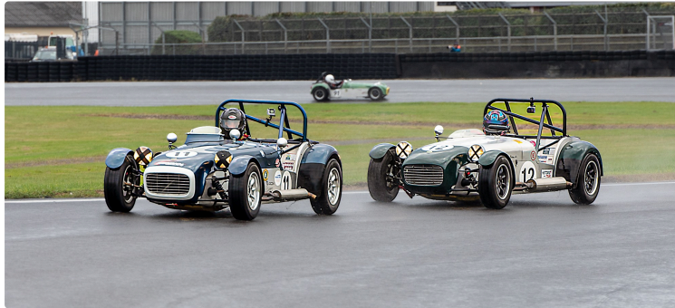
Album du Grand Prix de Nogaro Historic Tour

La météo a été humide le samedi 7 et le dimanche 8 matin