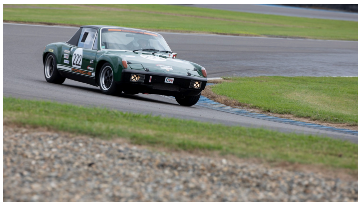
Maxi 2L Classic +Maxi 1300 Séries course 2 : Alain Lagache n°222 2e dans les 2 courses