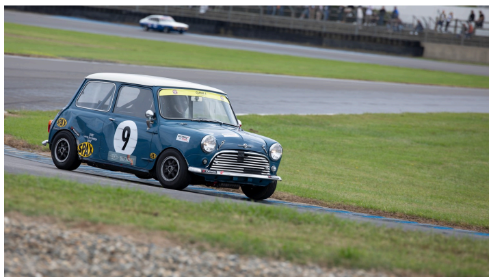
Maxi 2L Classic +Maxi 1300 Séries course 2 : Philippe Gandini n°9 sur Mini Cooper 4e à la course 1 et 2e à la course 2