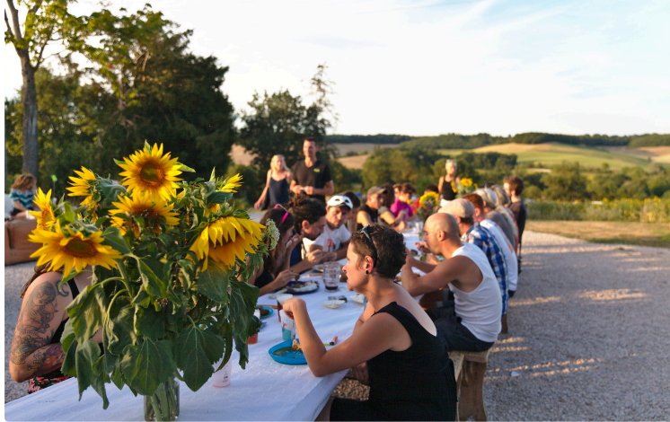
En passant par la Loustère, une journée festive et paysanne !

L'association Toc-Arts et l'Atelier des Huiles organisent leur désormais événement annuel : "En passant par la Loustère, une journée festive et paysanne!"