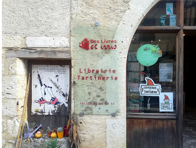
Programme de la Librairie Tartinerie de Sarrant.