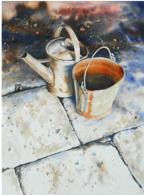
Le vieux couple

Et pour tout savoir sur l'artiste et ses œuvres, c'est ici : https://armagnaquarelle.odexpo.com/