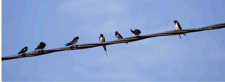
Elles sont parties...

Les hirondelles sont des oiseaux attachants notamment parce que leur apparition sur nos têtes annonce l'arrivée des beaux jours.