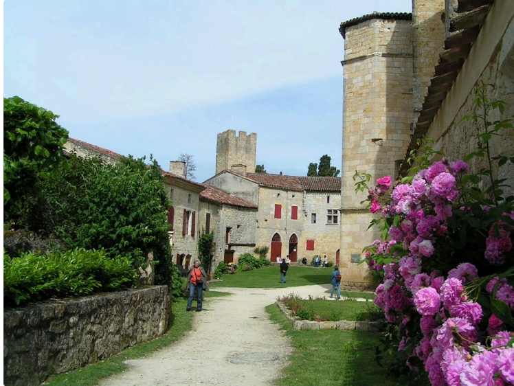
Tournoi d'archerie médiévale

Plongez dans les traditions médiévales le temps d'un week-end à la cité fortifiée de Larressingle.