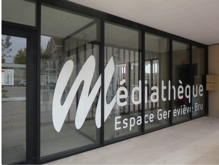
Des animations pour tous les goûts et toutes les générations