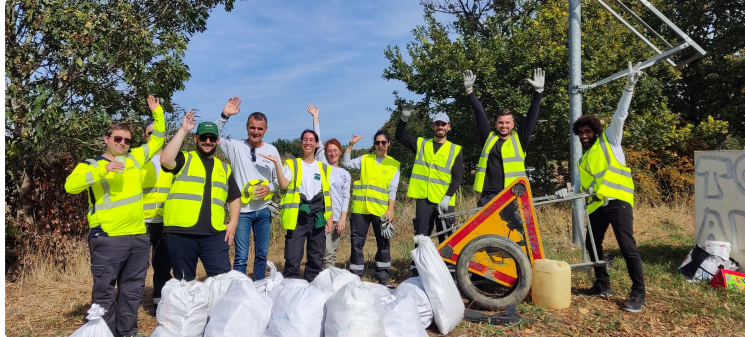
World Cleanup Day 2024 : agissez du 18 au 22 septembre pour une planète sans déchets !