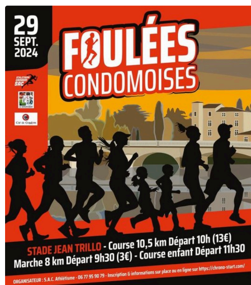
00000 condom foulées.jpg