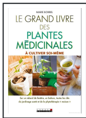
Le livre des plantes à cultiver sur son balcon