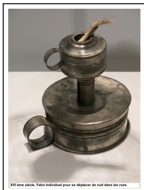
XVIème siècle. Falot individuel pour se déplacer de nuit dans les rues

Les conséquences d'une panne prolongée seraient encore plus insidieuses. Nous vivrions une régression rapide, une sorte de voyage forcé dans le temps. Sans électricité, la vie quotidienne se rapprocherait de celle du 19ème siècle. Plus de réfrigérateurs pour conserver les aliments, plus de plaques de cuisson électriques pour préparer les repas. La nourriture deviendrait un problème critique. Les denrées périssables commenceraient à pourrir, rendant les rayons des supermarchés rapidement vides.