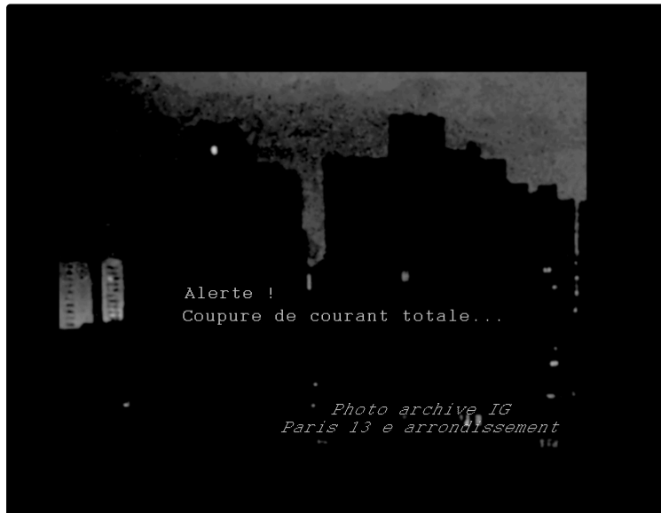
Plus de courant nul part... Piratage ? Bug ?

Que se passerait-il si une coupure de courant massive et prolongée survenait ?