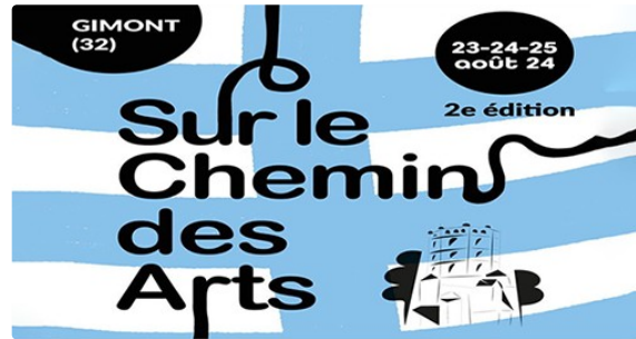
Chemin des arts 2eme édition

En route pour un merveilleux et inspirant Gimont sur le Chemin des arts 2024 !