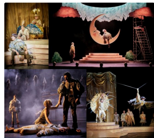
design sans titre.jpg