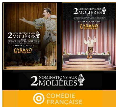
Design sans titre (4).jpg