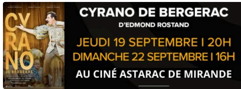
Design sans titre (1).jpg