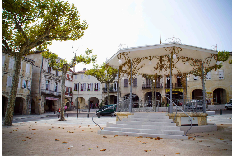
Mise à jour du plan cadastral de la commune de Vic-Fezensac

Le Pôle Topographique de Gestion Cadastre va procéder à la mise à jour du plan cadastral de la commune de Vic-Fezensac dans le cadre de sa tournée de conservation au titre de l'année 2024.