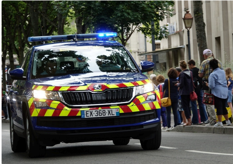
Les coups et blessures volontaires en constante augmentation dans le Gers. Voici les chiffres.

Les coups et blessures volontaires ont doublé en six ans dans le département.