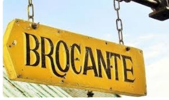
La 30e brocante de Simorre : un rendez-vous incontournable pour les chineurs

Avec l'été bien installé, dimanche 25 août les rues de Simorre vont s'animer et se parer de couleurs à l'occasion de la 30e brocante annuelle. Cet événement, désormais devenu une véritable institution, attire chaque année des centaines de visiteurs passionnés de brocante et de trésors cachés. Cette édition promet encore une fois de ravir les amateurs de bric-à-brac et de bonnes affaires.