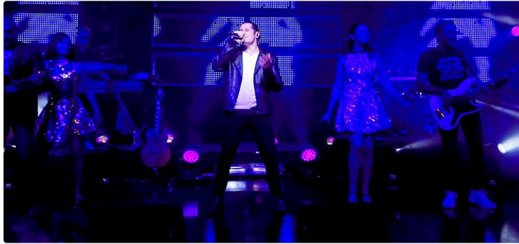
5 jours très animés au cœur des grandes fêtes de l'été...