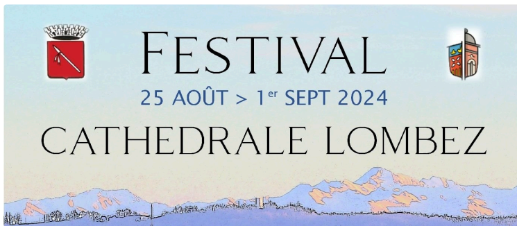
7e Festival de la Cathédrale de Lombez du 25 août au 1er septembre 2024

Le 7e festival d'Orgue de la Cathédrale de Lombez se déroulera du dimanche 25 août au dimanche 1er septembre 2024. De nombreux artistes donneront sept concerts autour du grand-orgue historique Monturus (1782) de la Cathédrale de Lombez, patrimoine vivant, accompagné de voix solistes de contre-ténor, soprano, mezzo-soprano, chœur basque de femmes et violon baroque, violoncelle, clavecin, cornet à bouquin ténor, trois serpents baroques, deux trompettes, trombone basse, saqueboute, timbales, percussions et un spectacle musical, scientifique et pédagogique tout public « Le Chant des étoiles » récitant, grand-orgue et bols chantants en cristal.