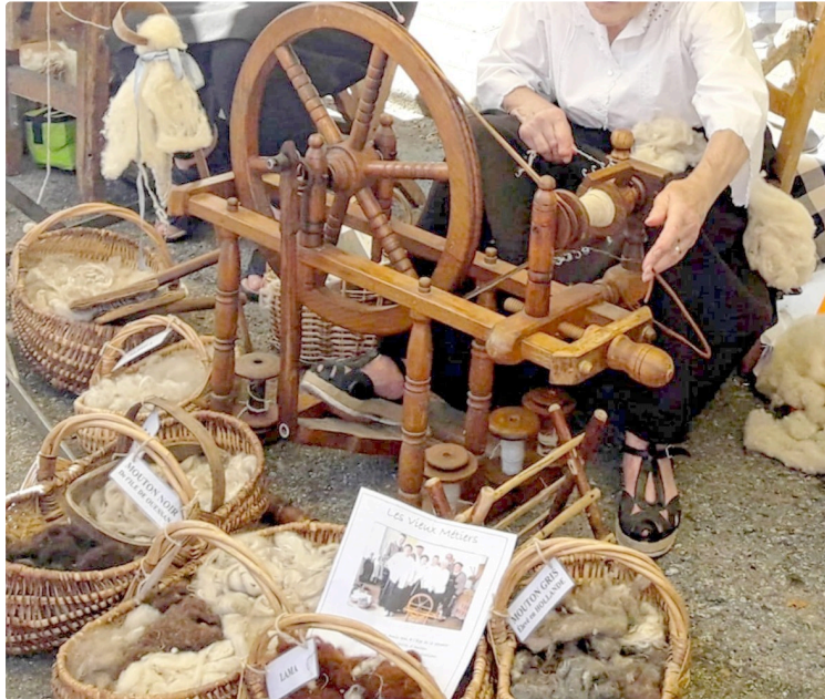
Lou Marcat de Beth Temps A, 32 eme édition !

Une Journée de Traditions et de Convivialité à Seissan