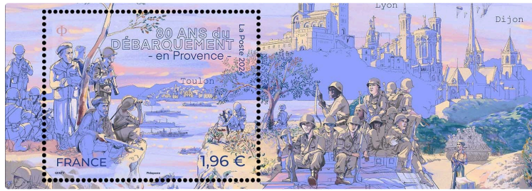
80 ans du débarquement en Provence

Le 16 août 2024, La Poste émet un bloc composé d'un timbre à l'occasion des 80 ans du débarquement en Provence.