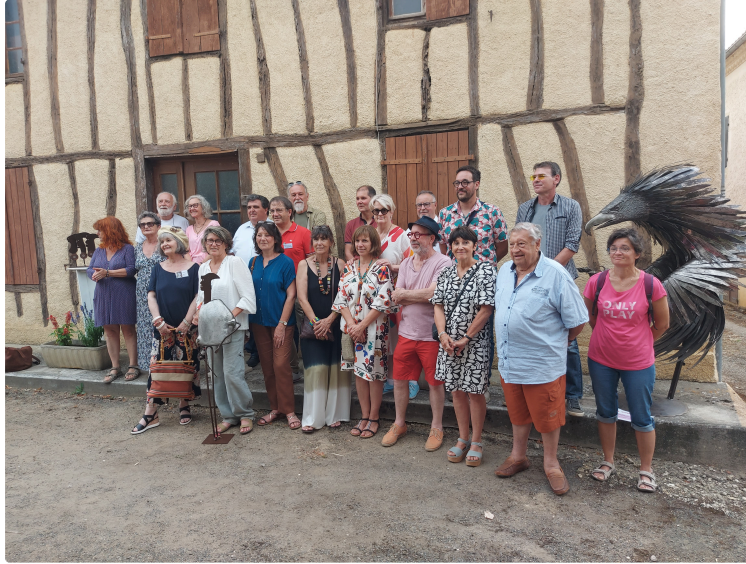
Le festival Avoz'art 11e édition a ouvert ses portes !