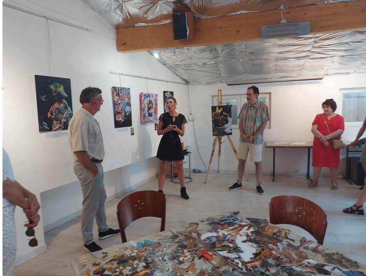
"A contra tempo", une exposition insolite à découvrir absolument !